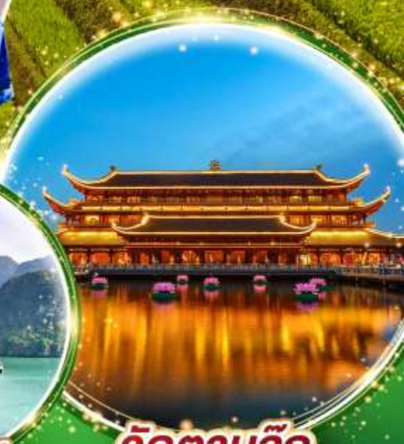
วัดตามจุก