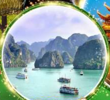
ฮาลองเบย์