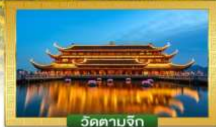
วัดตามจุก