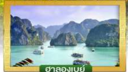
ฮาลองเบย์