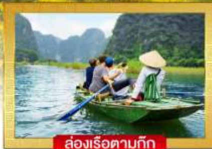
ล่องเรือตามก๊ก