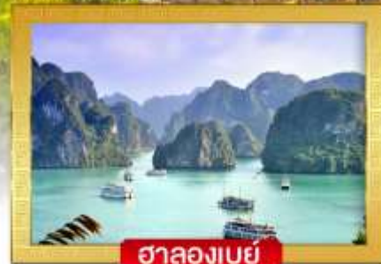
ฮาลองเบย์