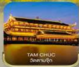
TAM CHUC วัดตามจุก

Premium Program เหมาลำ พีเรียดวันหยุดปีใหม่ | 5 วัน 3 คืน