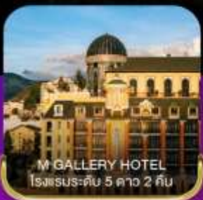
M GALLERY HOTEL โรงแรมระดับ 5 ดาว 2 คืน