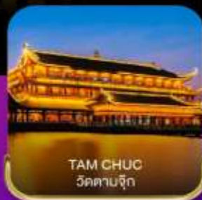
TAM CHUC วัดตามจุก