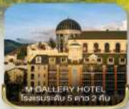
M GALLERY HOTEL โรงแรมระดับ 5 ดาว 2 คืน