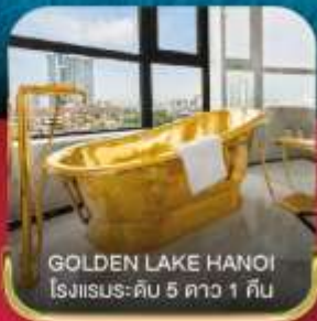
GOLDEN LAKE HANOI โรงแรมระดับ 5 ดาว 1 คืน