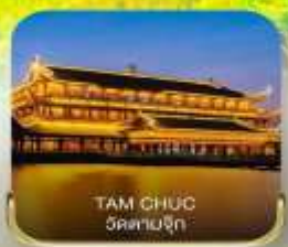
TAM CHUC วัดเขาจุก