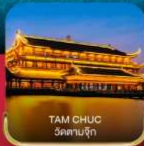
TAM CHUC วัดตามจิก