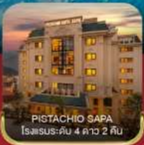
PISTACHIO SAPA โรงแรมระดับ 4 ดาว 2 คืน