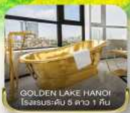
GOLDEN LAKE HANOI โรงแรมระดับ 5 ดาว 1 คืน