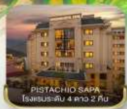
PISTACHIO SAPA โรงแรมระดับ 4 ดาว 2 คืน