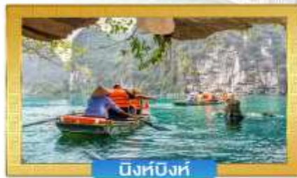
บิงห์บิงห์