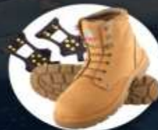
รองเท้าสำหรับเดินบนหิมะ น้ำแข็ง หรือติดกับหิน Ice grippers