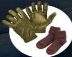
ถุงมือขนนวม ถุงเท้ากันหนาวแบบหนา