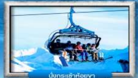
นั่งกระเช้าห้อยขา