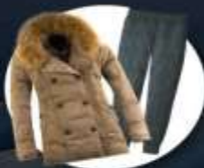
เสื้อและกางเกง กันหนาว, กันลม