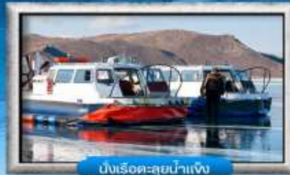
นั่งเรือ-ลุยน้ำแข็ง