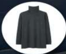
Heattech (ฮีทเทค) ระบบนาฬิกา กึ่งกางเกงและเสื้อ