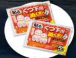
แพคเกจร้อนสำหรับ ให้ความอบอุ่นร่างกาย