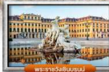
พระราชวังเฮินรุนนี