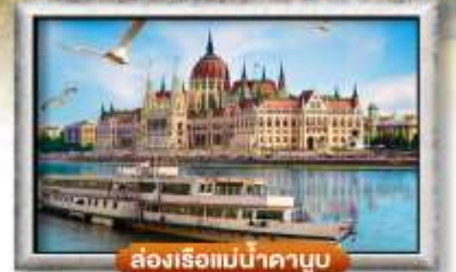
สองเรือแม่น้ำคาบูบ

พิเศษ!! ลิ้มลองเมนูประจำชาติ ทั้ง 5 ประเทศ!!!