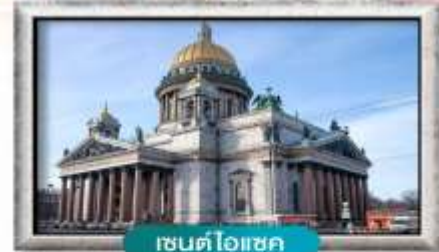
เซนต์ไอแซค