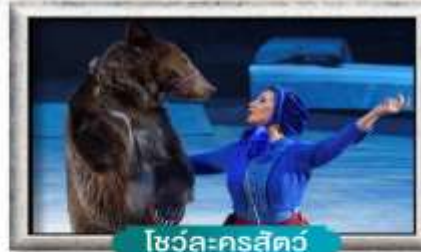
ไซว้ละครสั๊ว