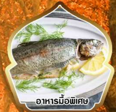
อาหารเนื้อพิเศษ