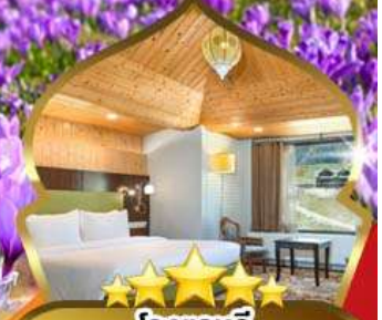
★★★★★ โรงแรมดี ระดับ 5 ดาว