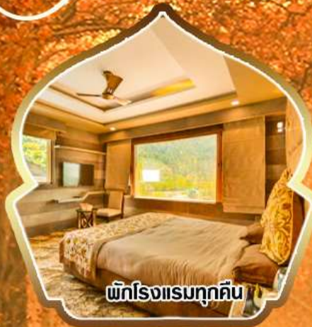
พักโรงแรมทุกคืน