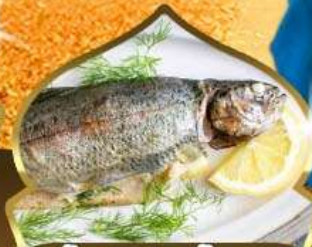
ลิ้มรสอาหารมือพิเศษ ปลาเทราต์แคชเมียร์