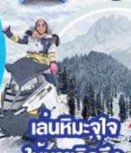
เล่นหิมะ-จ้ำจ ให้หายคิดถึง