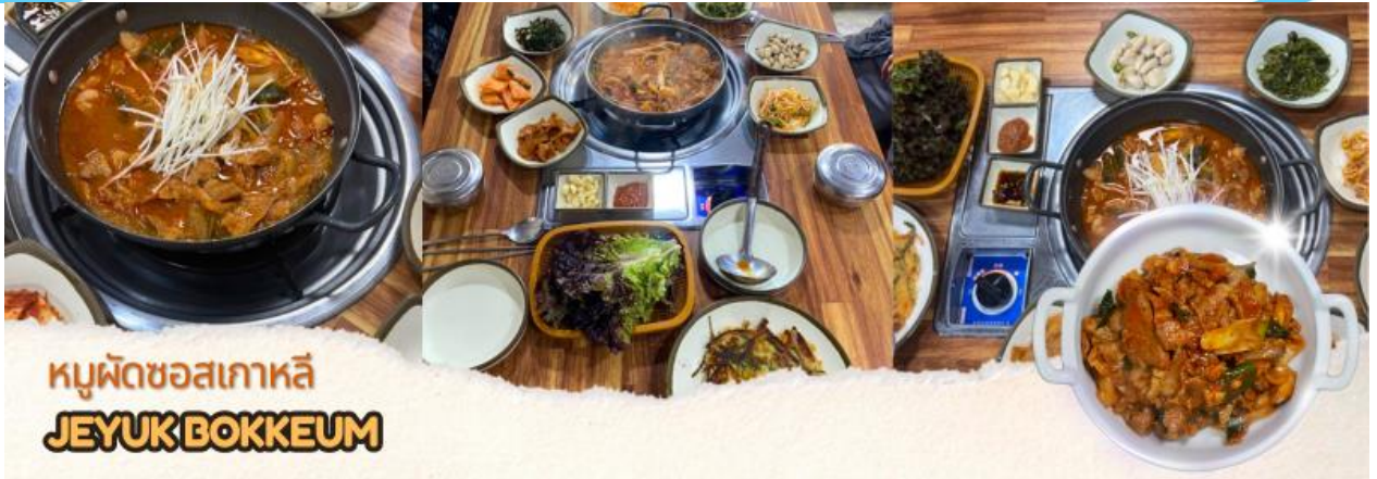
หมูผัดซอสเกาหลี JEYUK BOKKEUM