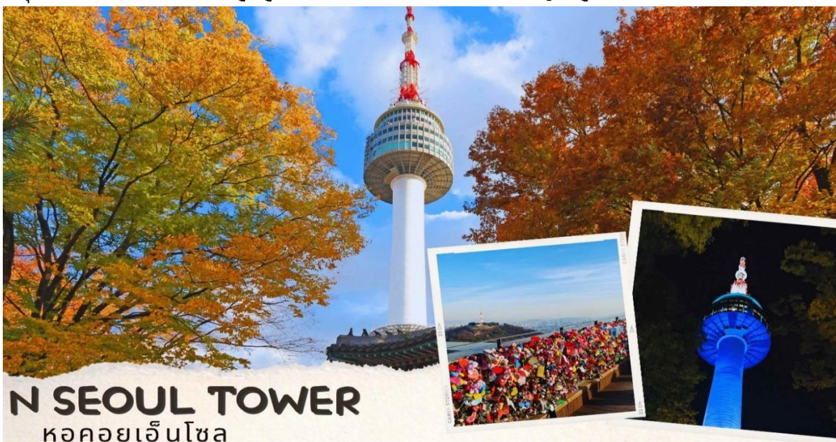
N SEOUL TOWER หอคอยเอ็นโซล

หลังจากนั้น นำท่านไปช้อปปิ้งที่ ศูนย์รวมเครื่องสำอางแบรนด์ดังเกาหลี (COSMETIC SHOP) เช่น WATER DROP (ครีมหน้าแตก) , SNAIL CREAM (ครีมเมือกหอยทาก) , BOTOX (โบทีอกซ์) , ALOE VERA PRODUCT (ผลิตภัณฑ์จากสมุนไพร ว่านหางจระเข้) เป็นต้นหลังทานอาหารเย็น จากนั้นนำท่านสู่ หอคอยกรุงโซล N Tower (ไม่รวมค่าลิฟต์) ซึ่งอยู่บริเวณเนินเขานัมซานซึ่งเป็น 1 ใน 18 หอคอยที่สูงที่สุดในโลกที่ฐานของหอคอยมีสิ่งที่น่าสนใจต่างๆ เช่น ศาลาแปดเหลี่ยมพลาทีกักจอง, สวนสัตว์เล็กๆ, สวนพฤกษชาติ, อาคารอนุสรณ์ผู้รักชาติอันสูงกุน อีสระให้ทุกท่านได้เดินเล่นและถ่ายรูปคู่หอคอยตามอัธยาศัยหรือคล้องกัญแจคูรัก