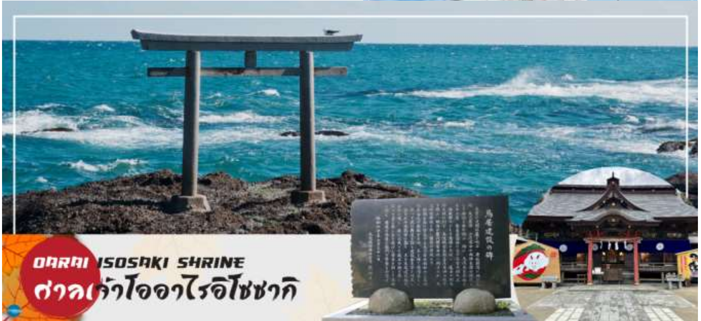
OARAI ISOSAKI SHRINE ศาลเจ้าโออาริอิซซากิ

มีชื่อเสียงในภูมิภาคคันโต ถูกเลือกให้เป็นทรัพย์สินทางวัฒนธรรมแห่งจังหวัด และได้รับความเชื่อถือมาอย่างยาวนานในฐานะเทพเจ้าผู้ให้ความคุ้มครองการคมนาคมทางทะเล และความสงบสุขภายในครอบครัว นำท่านรับพลังงานบวก ณ เสาโทริอิแห่งคามิอิโซะ (Kamiso no Torii) โทริอิสี่เสาที่หนึ่งสงบ บนโขดหินท่ามกลางฟองคลื่นสีขาวที่สาดกระเซ็น ซึ่งเป็นที่ประดิษฐานของเทพเจ้าโอนามุจิโนะมิโคโตะ และ เทพเจ้าสุคุนะฮิโคเนะโนะมิโคโตะ สร้างขึ้นตั้งแต่ 29 ธันวาคม ค.ศ.856 รวมทั้งยังเป็นจุดถ่ายรูปพระอาทิตย์ขึ้นที่มีชื่อเสียง มีนักท่องเที่ยวมากมายมาเฝ้าคอยเพื่อเก็บภาพช่วงเวลาที่แสงตะวันสาดส่องขึ้นสู่ขอบฟ้า