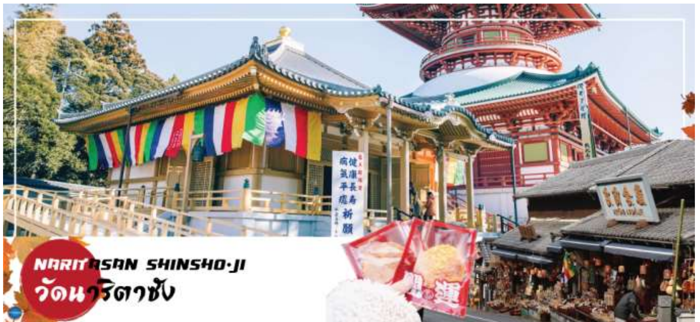
NARITASAN SHINSHO-JI วัดนาริตาซัง

วันที่สอง ท่าอากาศยานนานาชาตินาริตะ – เมืองนาริตะ – วัดนาริตะชั้น – ถนนปลาไหล โอโมเตะซังโตะ – ย่านโอไดบะ – ห้างไดเวอร์ซิตี – เมืองนาริตะ