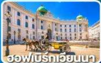
ฮอฟบิรทเวียนนา