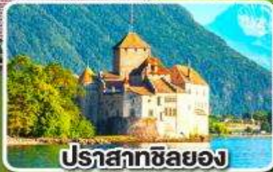
ปราสาทซิลยง