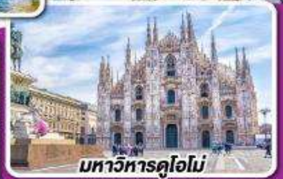
มหาวิหารดูโอโม