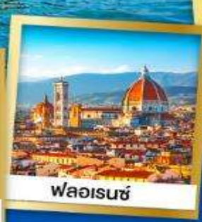
พลาเวินซ์