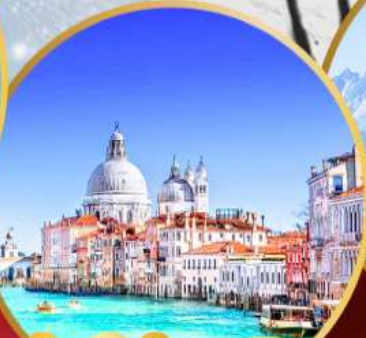
ล่องเรือสู่เกาะเวนิส