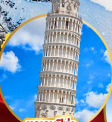
หออนปีซ่า