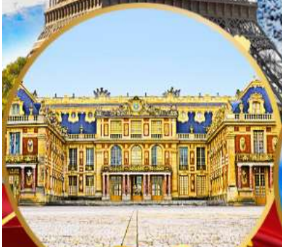
พระราชวังแวร์ซาย