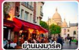
ย่านมงมาร์ต