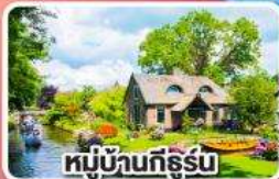
หมู่บ้านกังธูร์น

พิกปารีสและอัมสเตอร์ดัม อย่างละ 2 คืน ไม่ต้องเปลี่ยนโรงแรมบ่อย