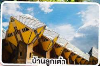
บ้านลูกเต๋าคี