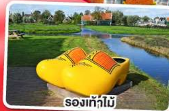
รองเท้าไม้