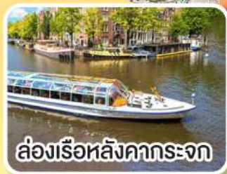
ล่องเรือหลังคากะจก

พิเศษ!! เมนูหอยแมลงภู่อบไวน์ขาว ล่องเรือหมู่บ้านไร้ถนน ที่รูร์น