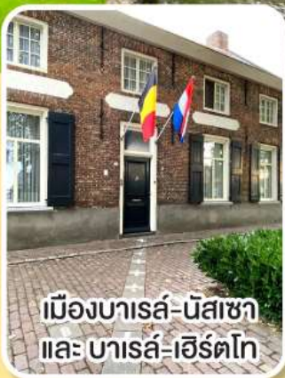
เมืองบารส์-นัสซา และ บารส์-เฮิร์ตโก