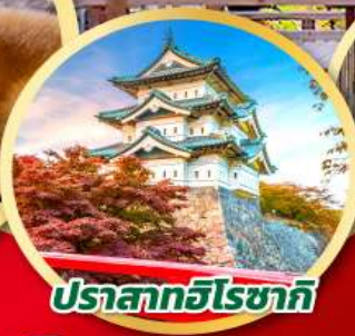
ปราสาทอิโรซากิ