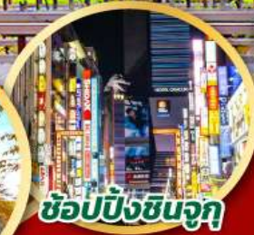
ช้อปปิ้งชินจูกุ