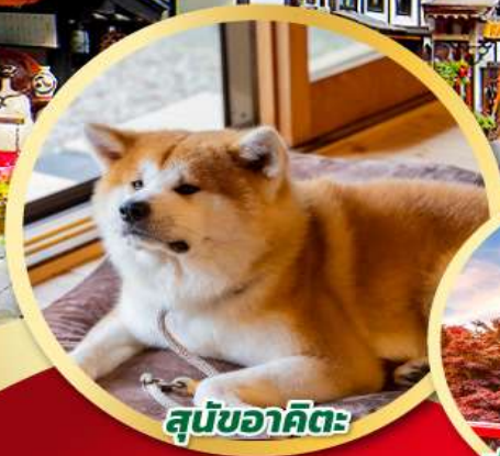
สุนัขอาคิตะ