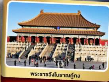
พระราชวังโบราณกรุงปักกิ่ง