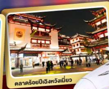
ตลาดร้อยปีเจิ้งหวงเหมียว