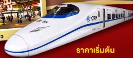
ราคาเริ่มต้น