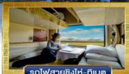
รถไฟสายชิงไห่-ทิเบต