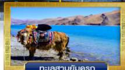
ทะเลสาบยัมตรก

เดินทางโดย: สายการบินลัคกี้แอร์ & โซน่าอิสเทิร์นแอร์ไลน์