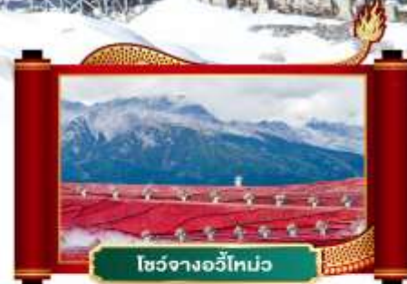
โชว์จางอวี๋โหม่ว