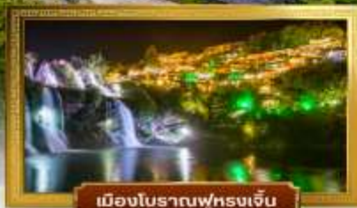
เมืองโบราณฟุหรงเจิน