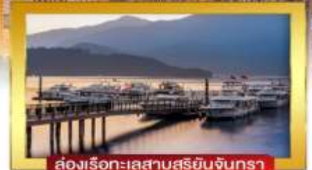
ส่องเรือทะเลสาบสุริยันจันทรา