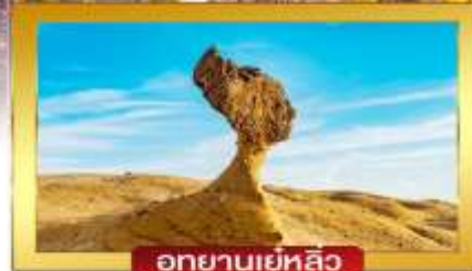
อุทยานเยลลิว