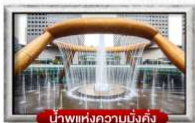
น้ำพุแห่งความมั่งคั่ง