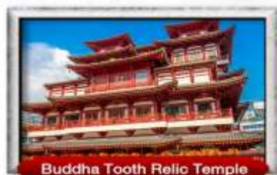
Buddha Tooth Relic Temple