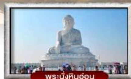
พระนั่งหินอ่อน