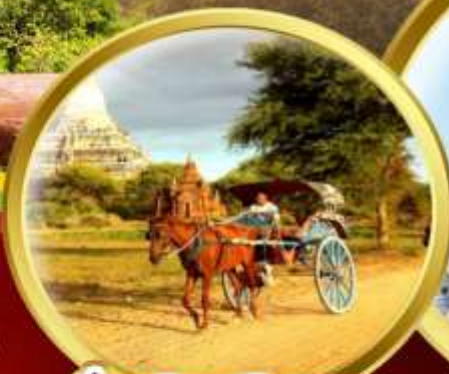
นั่งรถม้าชมเมืองพุกาม