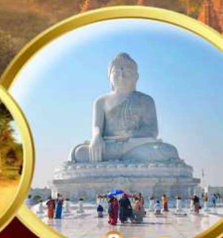
พระนั่งหินอ่อน