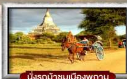
นั่งรถม้าชมเมืองพุกาม