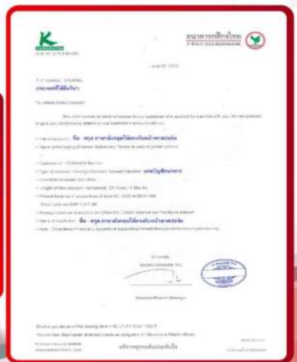
ตัวอย่าง Bank Guarantee ที่ผู้สมัครต้องยื่นธนาคาร