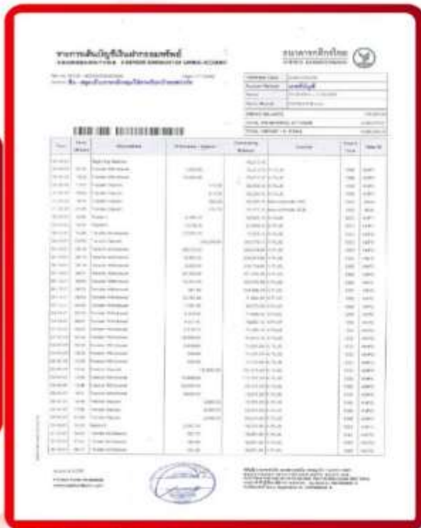
ตัวอย่าง Bank Statement ที่ผู้สมัครต้องยื่นธนาคาร

3.3 ปรับสมุดบัญชีธนาคารตัวจริง และเตรียมไปในวันที่ยื่นวีซ่า