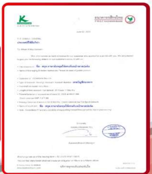
ตัวอย่าง Bank Statement ที่ผู้สมัครต้องขอธนาคาร