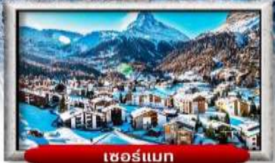
เซอร์แมส

บินทรู สายการบิน Full Service | พิเศษ! ลี้มลองพองดู 3 ชนิด