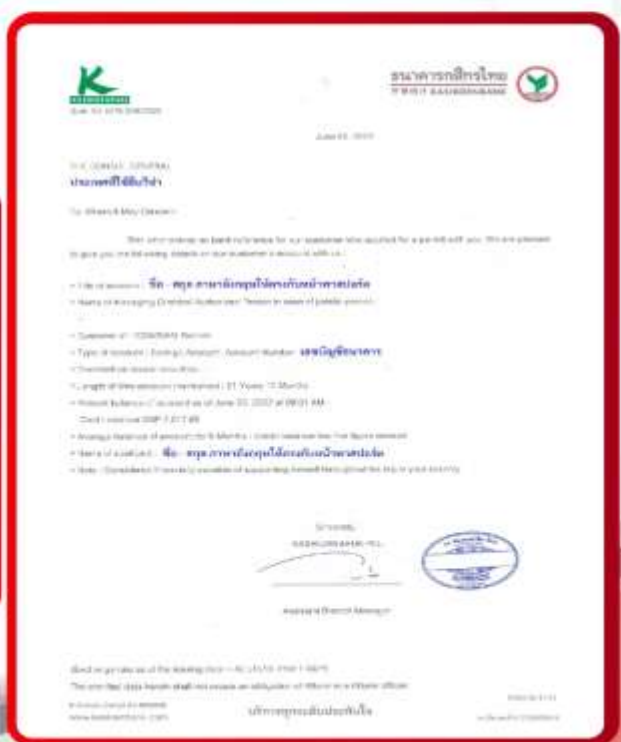
ตัวอย่าง Bank Guarantee ผู้สมัครต้องยื่นธนาคาร