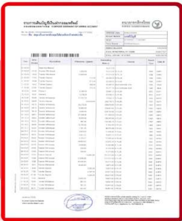
ตัวอย่าง Bank Statement ผู้สมัครต้องยื่นธนาคาร

3.3 ปรับสมุดบัญชีธนาคารตัวจริง และเตรียมไปในวันที่ยื่นวีซ่า