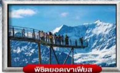
พิชิตยอดเขาเพียส