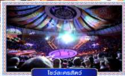
โชว์ละครสัตว์