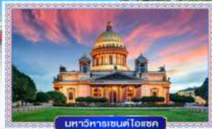
มหาวิหารเซนต์ไอแซค