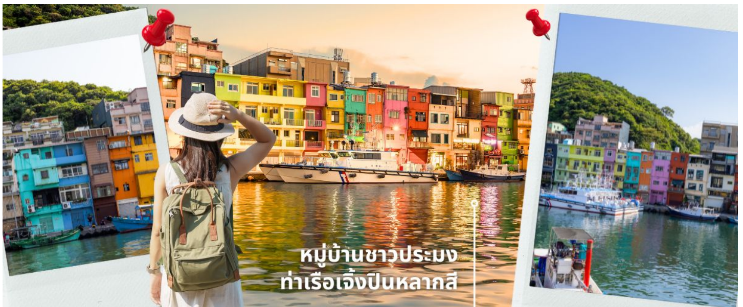
หมู่บ้านชาวประมง ท่าเรือเจิ้งปินหลากสี

นำท่านถ່านรูปสุดชิคที่ ท่าเรือเจิ้งปิน เมืองจีหลง อีกหนึ่งสถานที่ท่องเที่ยวอดฮิตของเมืองจีหลง (Keelung) ในตอนนี้ น่าจะหนีไม่พ้น ท่าเรือประมงเจิ้งปินเป็นท่าเรือที่ใหญ่ที่สุดในไต้หวัน ทำให้ในยุคแรกๆ