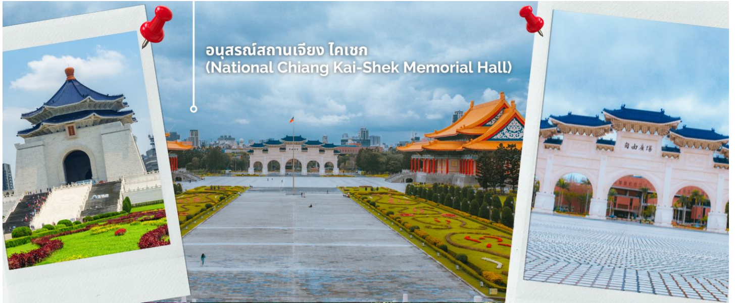
อนุสรณ์สถานเจียง ไคเชก (National Chiang Kai-Shek Memorial Hall)

อ่อนสีขาวยเป็นชั้นตามแบบพีระมิดอียิปต์ หลังคาสีน้ำเงิน รวมทั้งยังมีสวนดอกไม้สีแดง ที่เป็นการแสดงออกทางสัญลักษณ์ให้เห็นถึงอิสรภาพ ความเท่าเทียม และความเป็นหนึ่งเดียวกัน ตามสีของธงชาติไต้หวัน