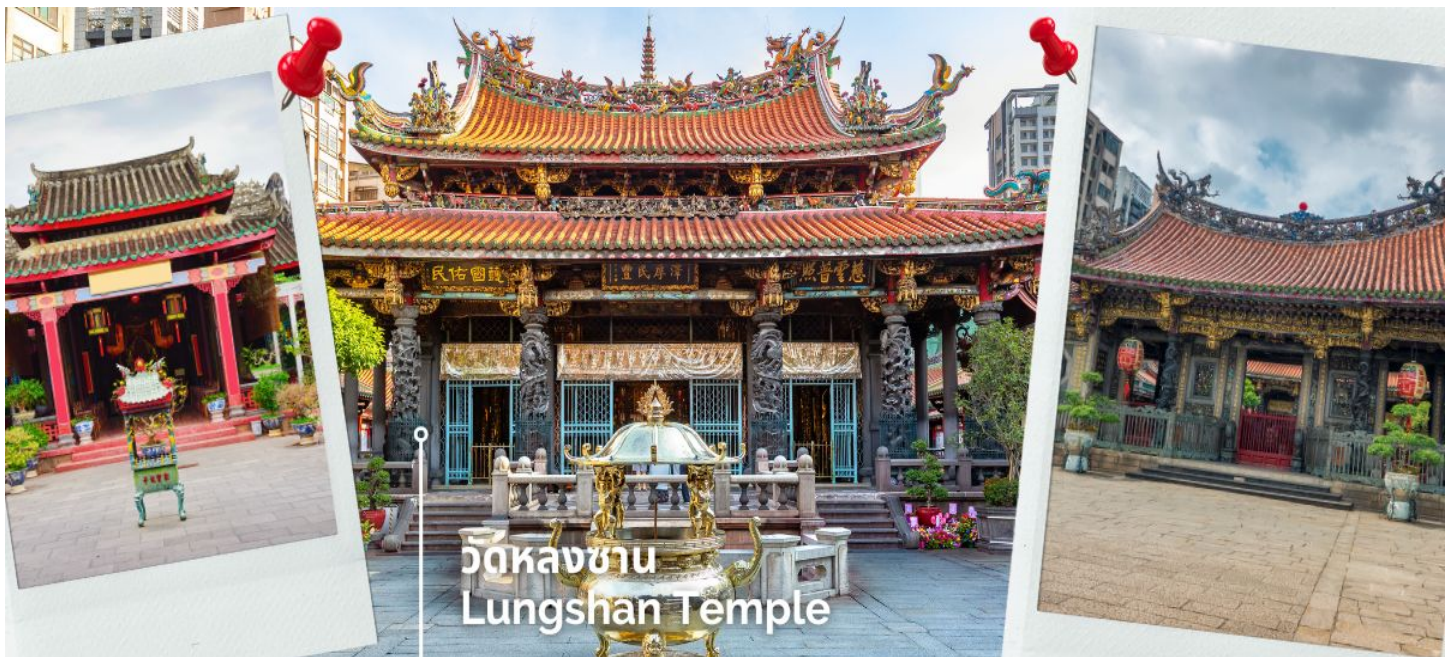
วัดหลงซาน Lungshan Temple

เที่ยง รับประทานอาหาร ณ ภัตตาคาร เมนูเสี่ยวหลงเปา (6) นำท่านสักการะ วัดหลงซาน เป็นหนึ่งในวัดที่เก่าแก่และมีชื่อเสียงมากที่สุดแห่งหนึ่งของเมืองไทเป ตั้งอยู่ในแถบย่านเมืองเก่า มีอายุเกือบ 300 ปี สร้างขึ้นโดยคนจีนชาวจีนผู้เจียนช่วงปีค.ศ. 1738 เพื่อเป็นสถานที่สักการะบูชาสิ่งศักดิ์สิทธิ์ตามความเชื่อของชาวจีน มีรูปแบบทางด้านสถาปัตยกรรมคล้ายกับวัดพุทธของจีน แต่มีลูกผสมของความเป็นไต้หวันเข้าไปด้วย ทำให้ที่นี่เป็นอีกหนึ่งแหล่งท่องเที่ยวที่ไม่ควรพลาด และภายในก็ยังมีเทพเจ้าองค์อื่นๆตามความเชื่อของชาวจีนอีกมากกว่า 100 องค์ด้านในมาจากทั้งศาสนาพุทธ เต๋า