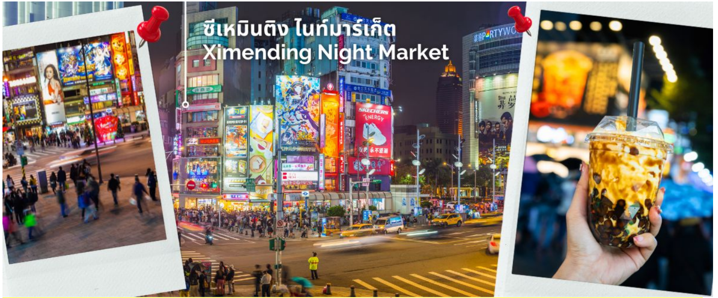
ซีเหมินติง ไท่มาร์เก็ต Ximending Night Market

ค่า อีสรอาหารค่ำ เพื่อให้ทุกท่านเต็มที่กับการช้อปปิ้งซึ่งไกด์จะแนะนำร้านอาหารร้านเด็ดร้านอร่อยให้นำท่านเข้าพักที่ DELIGHT HOTEL TAIPEI ระดับ 3 ดาว หรือเทียบเท่า