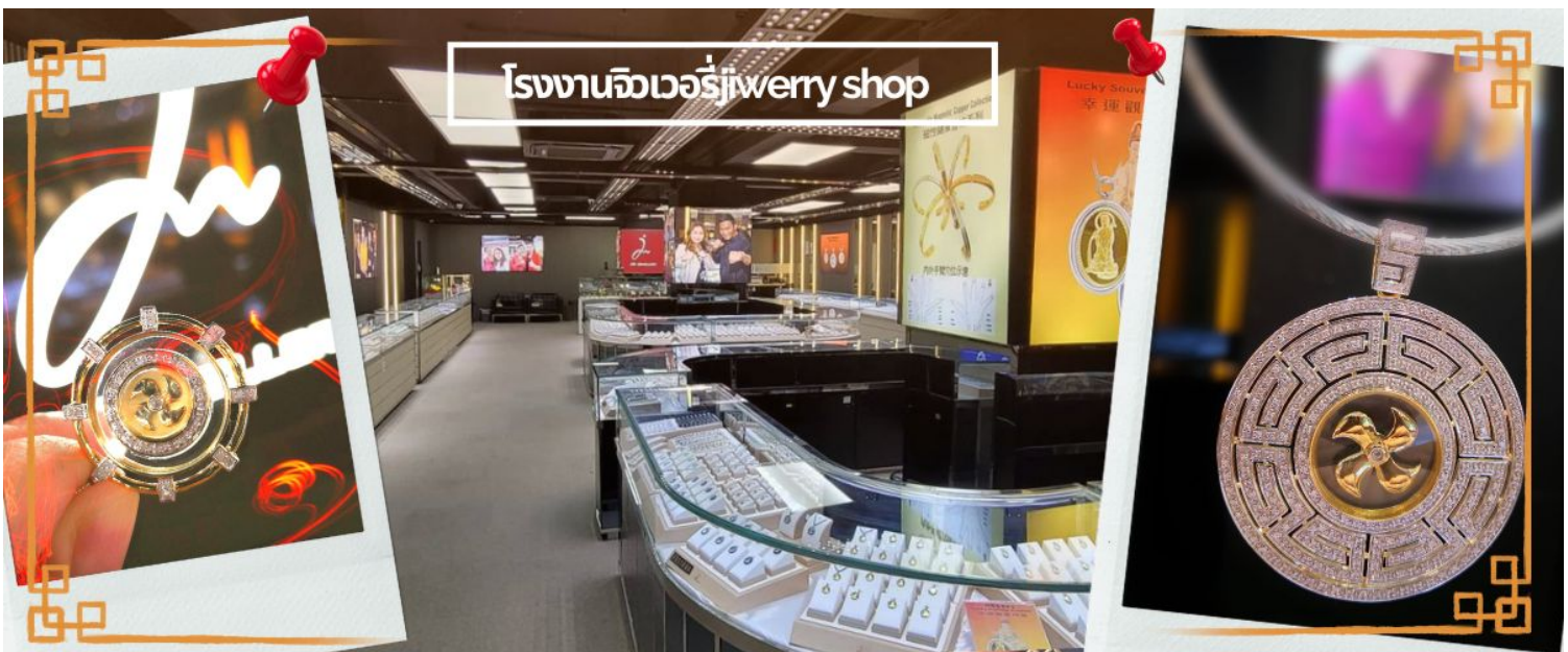
โรงงานจิวเวอรี่jewery shop

จากนั้นนำท่านชม โรงงานจิวเวอรี่ ซึ่งเป็นโรงงานที่มีชื่อเสียง ที่สุดของฮ่องกงในเรื่องการออกแบบเครื่องประดับ อาทิเช่น จี้ และแหวนกำหั้น ที่สวยงามโดดเด่นไม่เหมือนใคร ซึ่งถือกำเนิดขึ้นที่นี่และมีชื่อเสียงที่สุดใช้เป็นเครื่องประดับติดตัว และเสริมดวงชะตา สินค้าทุกชิ้นมีเอกสารรับประกันคุณภาพเปลี่ยน ซ่อม ได้ตลอดอายุการใช้งาน หากเกิดการชำรุดจากสินค้าไม่ใช่อุบัติเหตุ และนำท่านเลือกซื้อ เครื่องประดับที่ ร้านหยก ซึ่งคนจีนนั้นถือว่าหยกเป็นหิน ที่เป็นตัวแทนของความสวยงามและความบริสุทธิ์ มีความเชื่อว่าหยกมงคล ถ้าพกติดตัวไว้จะอายุยืนและสุขภาพดี