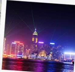
โชว์ SYMPHONY OF LIGHT