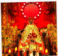
เจ้าแม่กวนอิมสองฮา