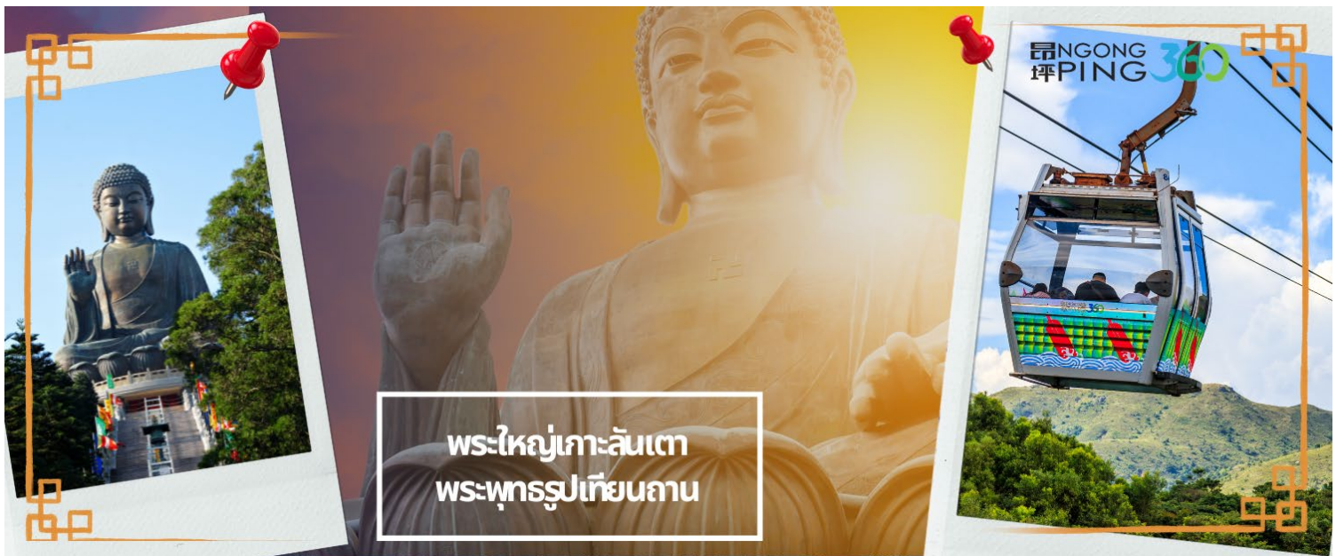
พระใหญ่เกาะลันเตา พระพุทธรูปเทียนถาน

จากนั้นเดินทางสู่เกาะลันเตา เพื่อไปที่สถานีตุงซุง ท่านจะได้สัมผัสกับประสบการณ์ที่น่าตื่นตาตื่นใจจาก กระเช้าลอยฟ้านองปิง (NGONG PING SKYRAIL 360 **STANDARD CABIN**) ซึ่งถือได้ว่าเป็นแหล่งท่องเที่ยวอันมีเอกลักษณ์ระดับโลกของฮ่องกง ที่มีระยะทางกว่า 5.7 กิโลเมตร ใช้เวลาประมาณ 25 นาที ท่านจะได้สัมผัสบรรยากาศจากบนกระเช้ามุมสูง เส้นทางกระเช้าเชื่อมจากใจกลางเมืองตุงซุง ถึง หมู่บ้านวัฒนธรรมนองปิง บนเกาะลันเตา ท่านจะได้ชมวิวแบบพาโนรามา 360 องศา ของสนามบินนานาชาติฮ่องกง ทิวทัศน์เหนือท้องทะเลของทะเลจีนใต้ ชมวิวของเนินเขาอันเขียวขจี น้ำตก ลำธาร และป่าอันเขียวชอุ่มของอุทยานบนเกาะลันเตาเหนือ (**กรณีกระเช้านองปิง 360 มีการปิดซ่อมบำรุง หรือ มีการปิดเนื่องจากสภาพอากาศแปรปรวน ทางบริษัทฯ ขอสงวนสิทธิ์ในการเปลี่ยนเป็นใช้รถโค้ชของทางอุทยานในการเดินทาง เพื่อนำท่านขึ้นสู่หมู่บ้านวัฒนธรรมนองปิง บนเกาะลันเตาแทน**) จากนั้นนำท่านไปสักการะ พระใหญ่เกาะลันเตา หรือ พระพุทธรูปเทียนถาน (TIAN TAN BUDDHA STATUE) ที่ตั้งตระหง่านอยู่บริเวณริมหน้าผา เป็นพระพุทธรูปทองสัมฤทธิ์กลางแจ้งที่ใหญ่ที่สุดในโลก องค์พระทำขึ้นจากการเชื่อมแผ่นทองสัมฤทธิ์กว่า 200 แผ่น เข้าด้วยกัน น้ำหนักรวม 250 ตัน และสูง 34 เมตร หันพระพักตร์ไปทางด้านทะเลจีนใต้ และมองอย่างสงบลงมายังหุบเขาและโขดหินเบื้องล่างซึ่ง และเชิญท่านอิสระตามอัธยาศัย ลิ้มลองความอร่อยของ อาหารจีนต้นตำรับเมนู อาหารตะวันตก