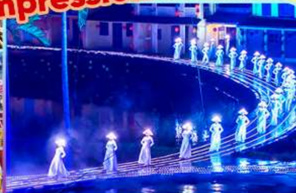
Hoi An Impression Show