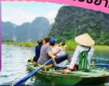
นั่งเรือกระจาด