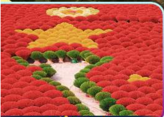
หมู่บ้านรูป