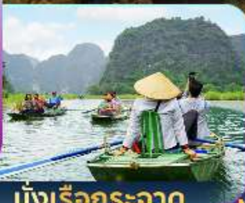
นั่งเรือกระจาด