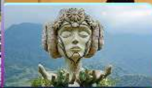
Moana Sapa Cafe