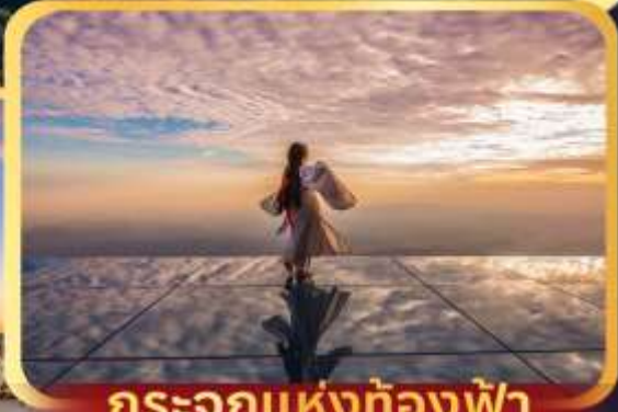
กระเจกแห่งท้องฟ้า