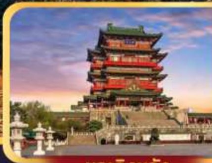
หอเกิ่งหวัง