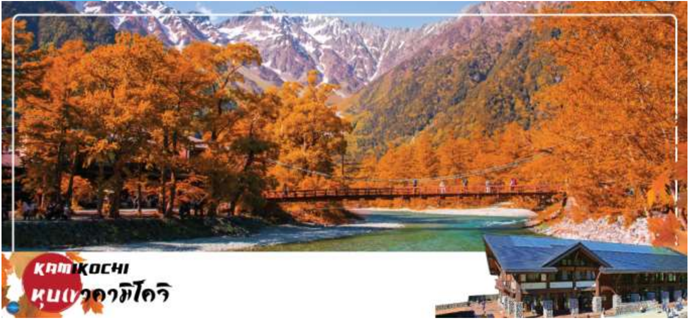
KAMIKOCHI หุบเขาคมิโคจิ

จากนั้นนำท่านเดินทางสู่ คามิโคจิ (Kamikochi) (ใช้เวลาเดินทางประมาณ 50 นาที) แหล่งท่องเที่ยวทางธรรมชาติที่มีทิวทัศน์เขาที่สวยงามที่สุดแห่งหนึ่งของประเทศญี่ปุ่น ดินแดนแห่งธรรมชาติท่ามกลางหุบเขาแสนสวยของเทือกเขา "เจแปน แอลป์" (Japan Alps) เป็นหุบเขาในพื้นที่อยู่สูงขึ้นไปทางเหนือของเทือกเขาแอลป์ญี่ปุ่น ภาพสายน้ำของแม่น้ำอะซุสะ ที่ใสสะอาดไหลผ่านสะพานคัปปะ ล้อมรอบด้วยต้นป่าเขียวขจี และฉากหลังของยอดเขาสูงตระหง่านระดับ 3,000 เมตรให้ท่านได้เพลิดเพลินกับการเดินเล่นสบายๆ ไปกับธรรมชาติที่สวยงาม อีสระให้ท่านได้เก็บภาพความประทับใจตามอธยาศัย สะพานคัปปะ-บะชิ เป็นจุดที่มีคนเยอะที่สุดในคมิโคจิ และในบางครั้งก็ให้ความรู้สึกเหมือนทางแยกที่มีชื่อเสียงของชินยะ มีผู้คนมากมายเดินข้ามไปข้ามมาอยู่ไม่หยุดหย่อน มาถ่ายรูปใกล้กับสะพานหรือบนสะพาน