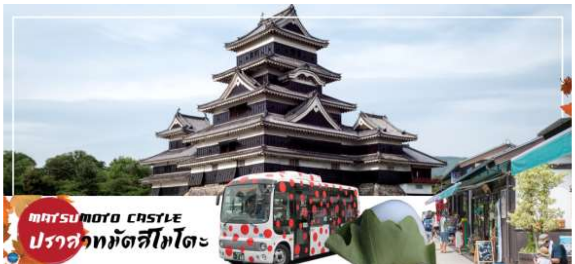
MATSUMOTO CASTLE ปราสาทมัตสึโมโตะ

นำท่านชม ปราสาทมัตสึโมโตะ (Matsumoto Castle) (ด้านนอก) เป็น 1 ใน 12 ปราสาทดั้งเดิมที่ยังคงสภาพสมบูรณ์และสวยงามที่สุดของประเทศญี่ปุ่น และเป็น 1 ใน 5 ปราสาทที่ได้รับการขึ้นทะเบียนเป็นสมบัติประจำชาติ เป็นปราสาทที่สร้างอยู่บนพื้นที่ราบ มีเอกลักษณ์ตรงที่มีหอคอยและป้อมปืนเชื่อมต่อกับโครงสร้างอาคารหลัก และเนื่องจากผนังปราสาทมีสีดำและปีกด้านต่างๆ ของปราสาทแผ่กางออกเหมือนปีกนก เลยมีชื่อเรียกว่า คาราซุโจ ที่แปลว่า ปราสาทอีกา สำหรับข้างในตัวปราสาทมีชั้นบันไดสูงชันและเพดานที่ไม่สูงมาก บริเวณทางเดินจัดแสดงวัสดุเครื่องใช้ทาง