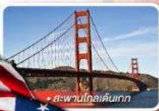
สะพานโกลเด้นเกต