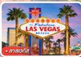
ลาสเวกัส