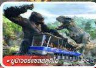
ยูนิเวอร์แซลสตูดิโอ