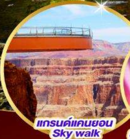
แกรนด์แคนยอน Sky walk