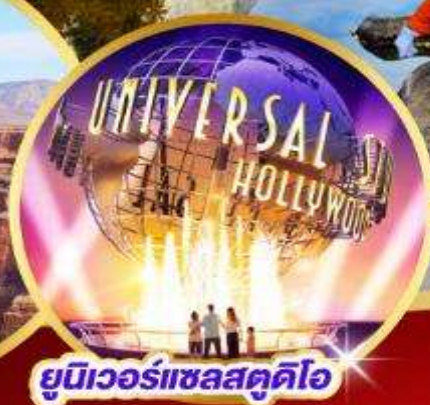
ยูนิเวอร์แซลสตูดิโอ