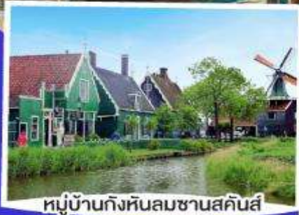
หมู่บ้านกังหันลมซานสคินส์