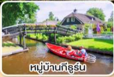
หมู่บ้านกังธูร์น