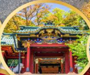
ศาลเจ้าโทโชกุ