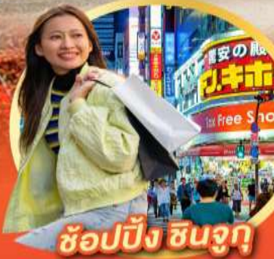
ช้อปปิ้ง ซินจูกุ

นั่งกระเช้าชมวิว ใบไม้เปลี่ยนสี Mt. Adatara