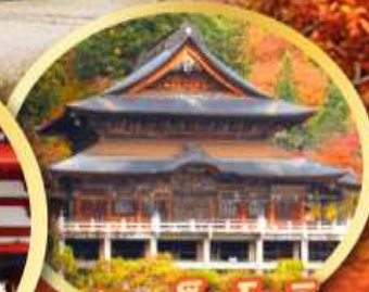
วัดเอ็นโซจิ

กิจกรรมเก็บผลไม้ พักออนเซ็น 2 คืน พักโรงแรมในโตเกียว 2 คืน