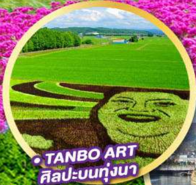
TANBO ART ศิลปะบนทุ่งนา