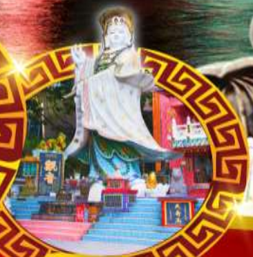
เจ้าแม่กวนอิม ศาลีฟัสลีย์

เมนูสุด พิเศษ!! ต้มช่าฮ่องกง บุฟเฟ่ต์ชาบูสไตล์ฮ่องกง, ห่านย่าง